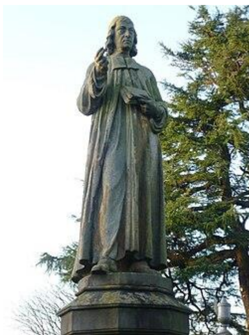
詹姆斯·格思裡雕像，斯特靈穀公墓，1857 年

就這樣，他們決定讓這卓越之人成為私人恩怨的犧牲品，好像侯爵定意絞死他是為了更崇高的復仇；據說，委員們對他的判決進行了不小的爭論，因為他們中的一些人勸他收回他所做的和所寫的，轉為擁護當前的原則和措施，甚至有人要給他一個主教職位。另一方則確信他不會改變自己的信仰和立場，因此這種試探不會有任何效果。主教職位對他來說是個很小的誘惑，而委員們則利用了他的堅定不屈，最終判處他死刑，以此來震懾他人，從而減少在重建主教制時反對的聲音。