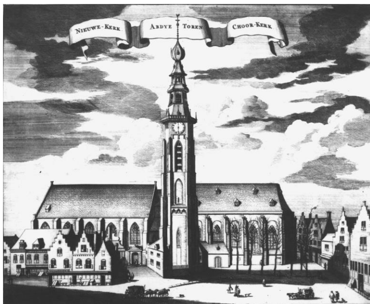
米德尔堡的新教堂

他侍奉的大部分时间里都与自己欠佳的健康状况做斗争，最终于 1629 年 4 月 8 日离世，享年 50 岁。成千上万的人哀悼他，他被葬在米德尔堡圣彼得教堂的墓地。