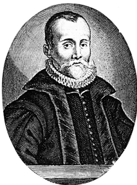
威廉·帕金斯（William Perkins, 1558 - 1602）