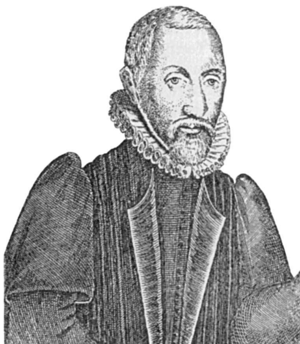
约翰·多德（John Dod, 1549 - 1645）