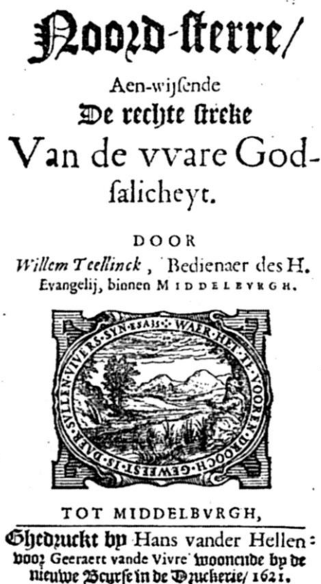
1621 年本书最早的出版封面

推广清教徒理念——由忠诚奉献之心滋养出全面成圣的生命，是泰林克的首要热情所在。因此，《真敬虔之路》才在众作品中被选中，最先译成英文。